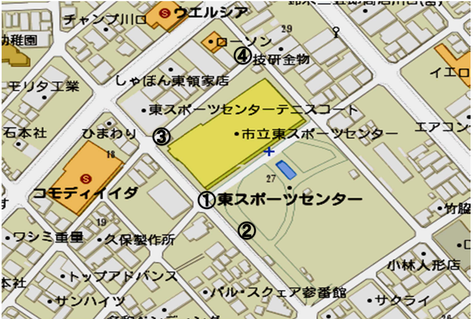
◎駐車場係り配置図